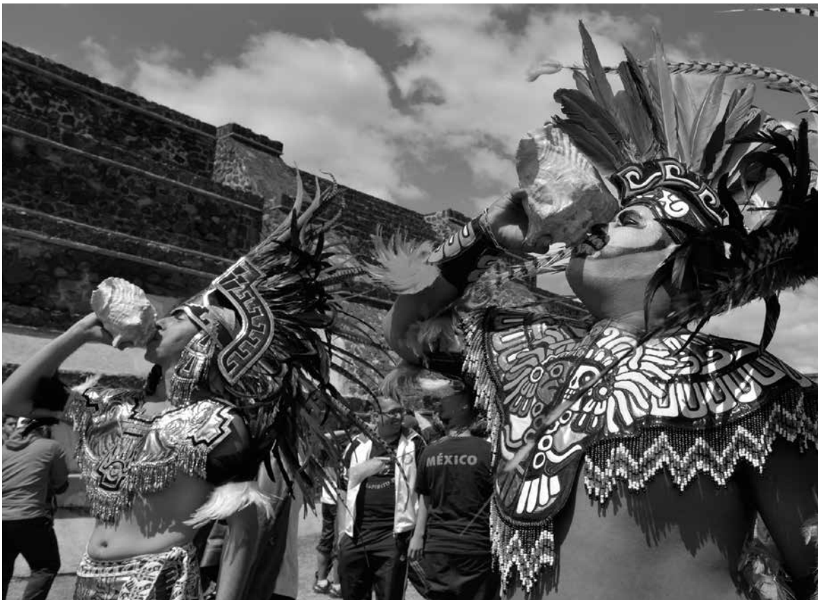
ÁNGEL MONTERO MONTAÑO ▶ Danzantes en la Zona Arqueológica de Teotihuacán, 2014.