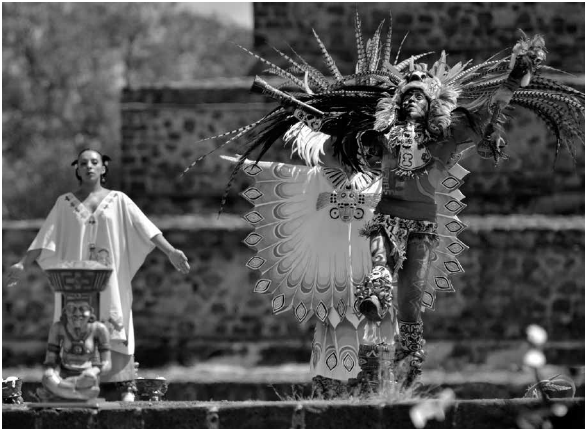
Danzantes en la Zona Arqueológica de Teotihuacán, 2014.