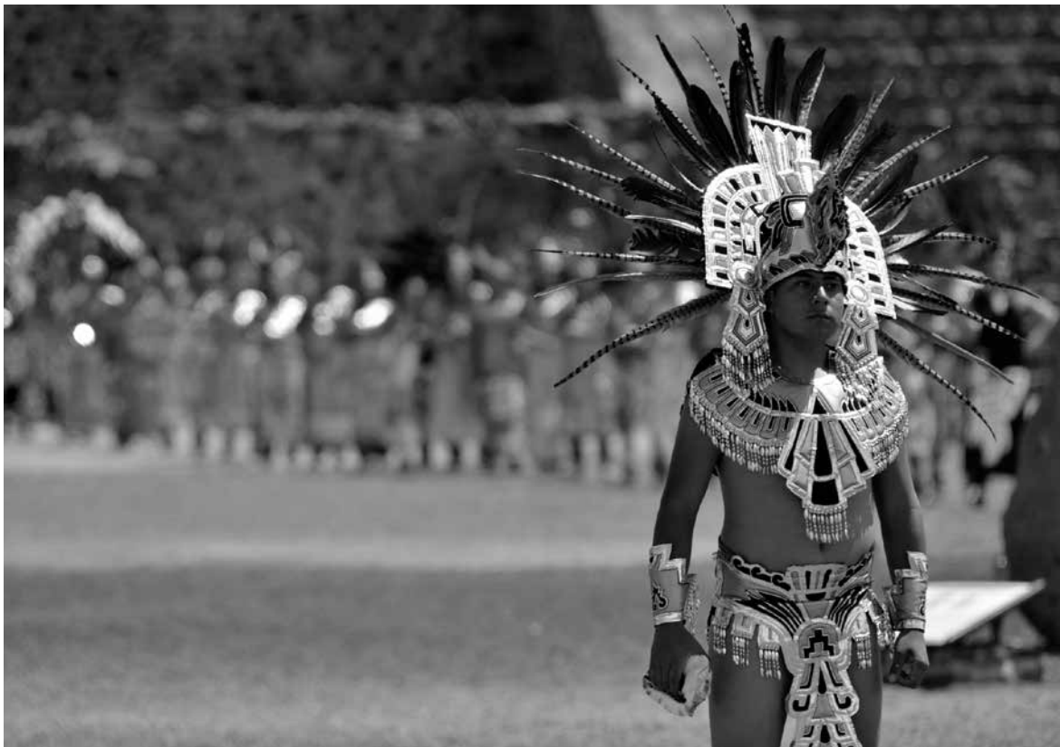
Danzantes en la Zona Arqueológica de Teotihuacán, 2014.