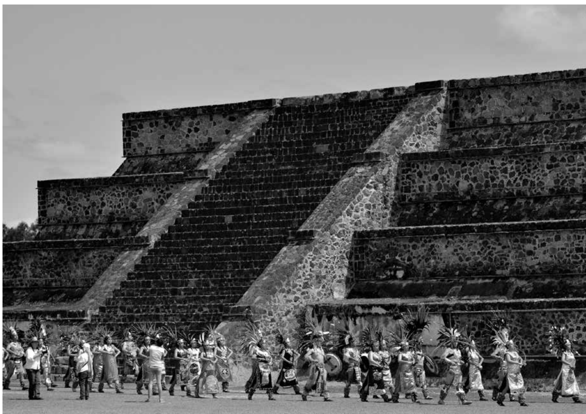
ÁNGEL MONTERO MONTAÑO ▶ Danzantes en la Zona Arqueológica de Teotihuacán, 2014.

carácter comunal de la tierra, la relevancia de la fiesta patronal, las fiestas comunales locales, el tlapalehuil —brindar ayuda material a quien tiene que realizar un gasto fuerte o pasa por algún problema—, el tetlayecotl —convidar a los vecinos alimentos para un evento especial—, el tetlapalol —visitar a los vecinos enfermos y llevarles alimentos o frutas— y el tequio (Florescano, 1997: 189).